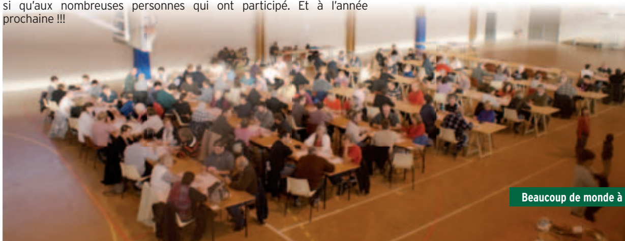
Beaucoup de monde à la belote

Merci également à tous les parents présents, aux enseignants ainsi qu'aux nombreuses personnes qui ont participé. Et à l'année prochaine !!!