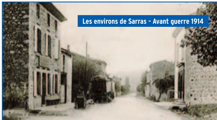
Les environs de Sarras - Avant guerre 1914