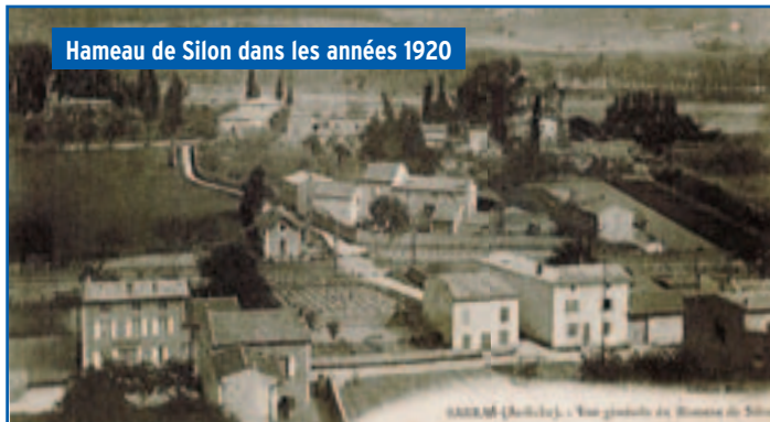
Hameau de Silon dans les années 1920

«Et en avant, marche ! Sur la route blanche, en plein midi, car le dîner nous attend au cabaret de Silon.» (1)