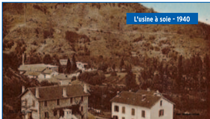
L'usine à soie - 1940

La voie de chemin de fer dû être surélevée, le PLM racheta l'autorisation de prélever des remblais sur un terrain au nord de la voie Romaine. La petite combe élargie permit à Monsieur MANOHA d'y reconstruire son exploitation agricole.