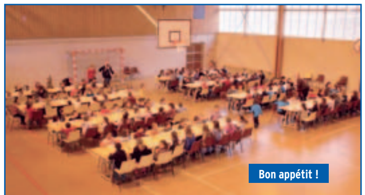
Bon appétit !

Cette fin d'année 2011 a une nouvelle fois permis de constater que le repas de Noël offert aux élèves des écoles maternelle et élémentaire a remporté une vive adhésion puisque 150 élèves environ étaient inscrits. Ce moment d'échange très joyeux jalonne en effet la dernière semaine de classe avant les vacances de Noël et même s'il est empreint d'une certaine excitation, ce menu de fêtes est toujours apprécié par nos jeunes amis ! Un grand merci au personnel communal qui a assuré la préparation de la salle ainsi que le service.