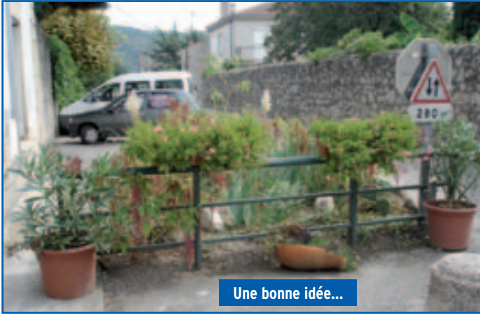
Une bonne idée...

L'idée était dans l'air... Nous sommes tous sensibles à notre environnement et comme dit le proverbe, "fleurissons devant notre porte... !" l'idée a donc fait son chemin.