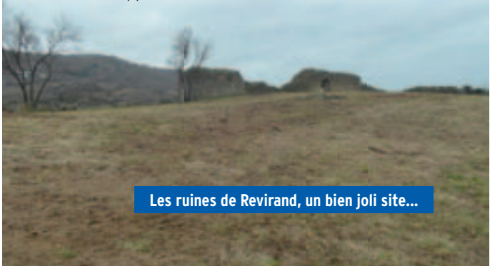
Les ruines de Revirand, un bien joli site...