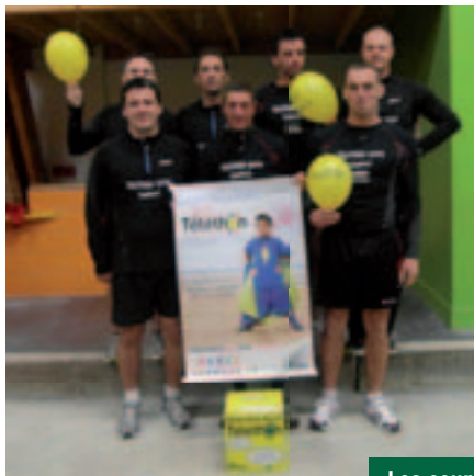
Les coureurs du fil rouge

Le Fougot cette année aura lieu le mardi 21 février, en cas de pluie rendez-vous à la salle des fêtes.