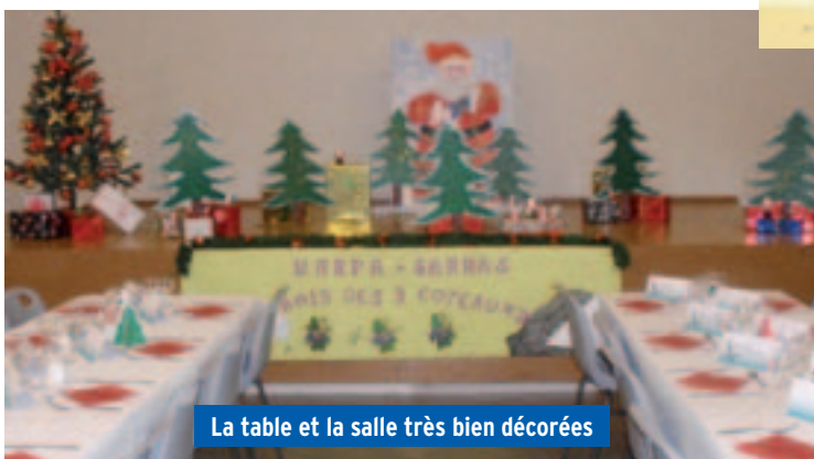
La table et la salle très bien décorées