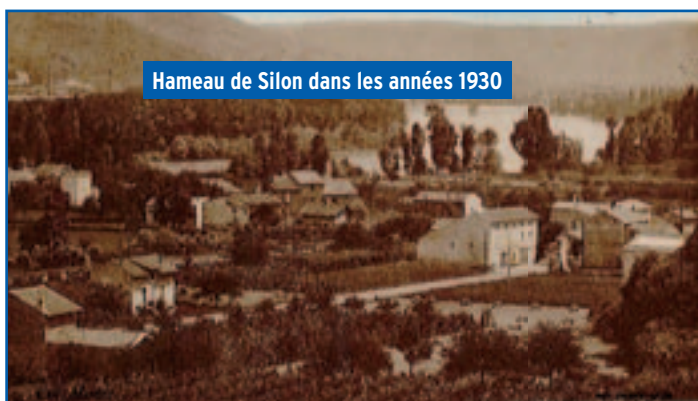
Hameau de Silon dans les années 1930

Le canal servait au rinçage du linge, une ou deux fois par an : le linge sale, principalement les draps, était descendu du grenier, vigoureusement frotté par des lavandières venues pour la journée de SARRAS. Il était déposé dans un grand cuvier de bois dans lequel on avait garni le fond d'une couche de sarments de vigne, d'une couche de cendres de bois, puis à nouveau des sarments de vigne et un linge posé à plat. L'eau bouillante était déversée sur le linge puis récupérée par le bas à nouveau réchauffée et déversée un grand nombre de fois. Retiré du cuvier, le linge était rincé à la rivière d'Ay pour les habitants du haut Silon, au canal pour le vieux Silon, ou dans le Rhône.