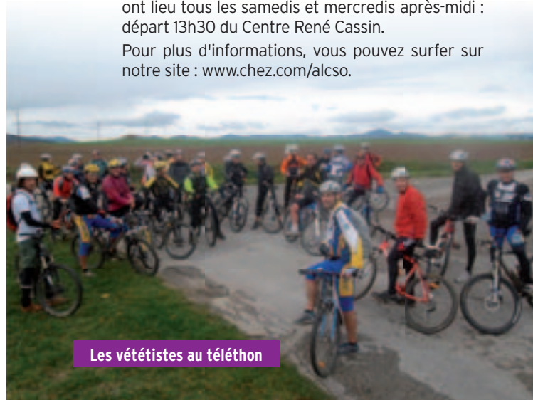
Les vététistes au téléthon

Pour plus d'informations, vous pouvez surfer sur notre site : www.chez.com/alcsoc .