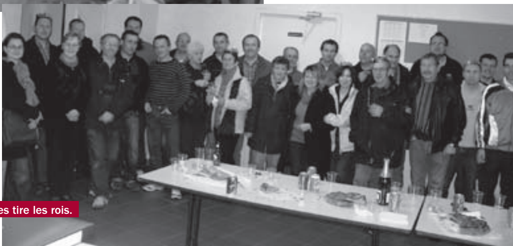
Le Comité des Fêtes tire les rois.

Venez nombreux partager ce moment de convivialité !