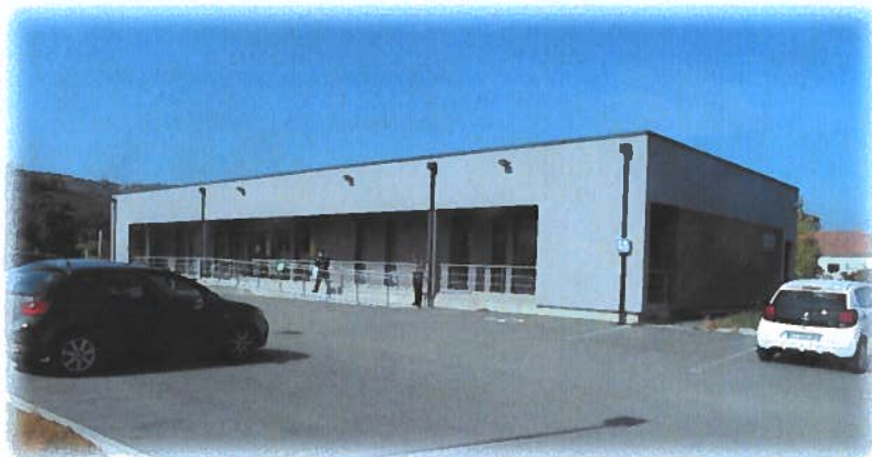
Les 2 cabinets de kinés

Hôpital avec service d'urgences à Saint Vallier, hôpitaux à Annonay, Valence et Romans.